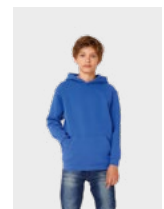
BESTAAT IN KIDS: B&C HOODED /KIDS